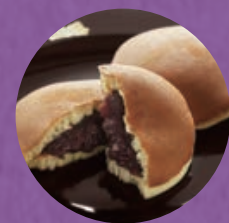
「うさぎや」 どらやき

アクセス●JR御徒町駅南口すぐ ●東京メトロ 仲御徒町駅、上野広小路駅 及び 都営地下鉄 上野御徒町駅 徒歩3分