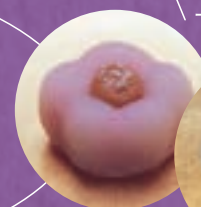
「つる瀬」 ふく梅 上用饅頭

「おかちまちパンダ広場」と 「湯島天満宮」でスタンプを押して 上野・湯島の「地元の逸品」を ゲットしよう!